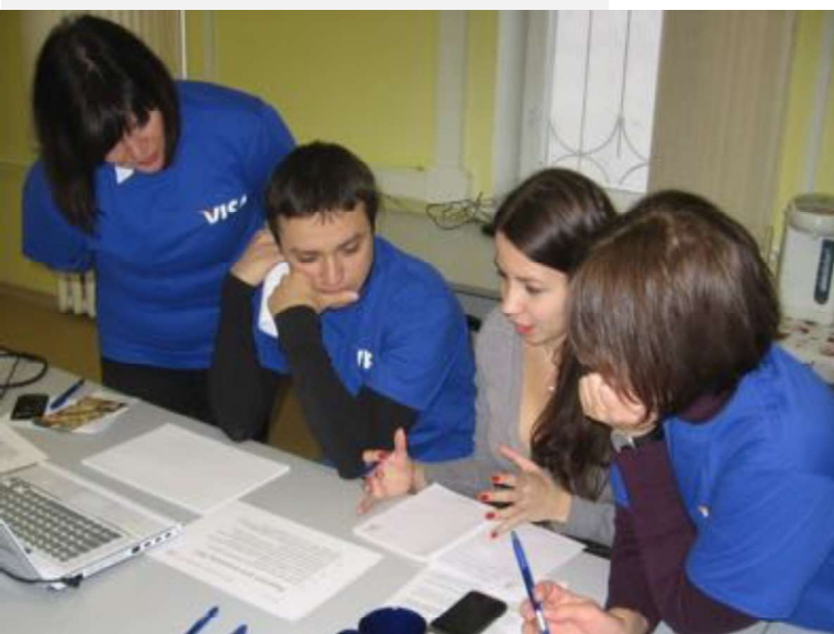
На фото: волонтеры компании VISA за разработкой новых идей для акции «Даешь Урок!»

Так, волонтеры компании VISA в этом году помогли нам усовершенствовать программу частных пожертвований «Даешь Урок!», предложив много ценных советов и свежих идей.