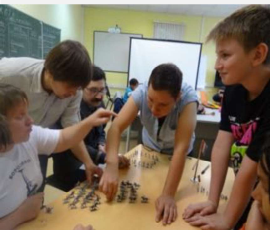
На фото: интерактивный урок истории, посвященный войне 1812 г.

Наша главная задача – помочь ребятам развить интерес к познанию себя и мира, а также желание и способность учиться самостоятельно.