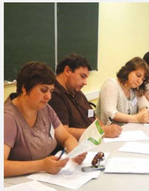
На фото: работа группы педагогов во время конференции в стенах «Большой Перемены»

Поэтому мы вышли на следующий этап освоения проектно-программного подхода и разработки социально-педагогических и психолого-педагогических программ, так как только после этого возможен успешный переход к партнерству с другими организациями, которые работают с детьми-сиротами как профессионалы.