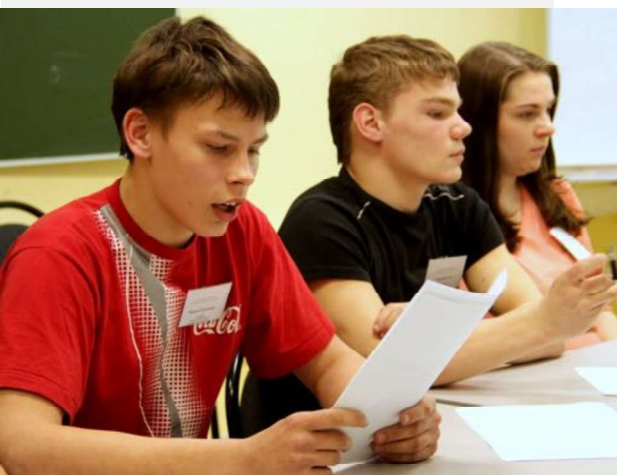
На фото: выступление студентов «Большой Перемены» на Студенческой конференции