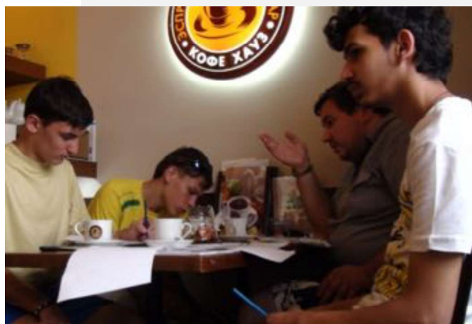
На фото: выработка стратегии прохождения квеста по г. Москве

Среди наших студентов есть также и те, для кого занятия по рисованию – это не просто хобби или дополнение к образовательному процессу, а путь к будущей профессии. Несколько наших студентов осваивают художественные специальности или планируют поступать в художественные колледжи, и занятия по рисованию им помогают овладеть выбранной специальностью.