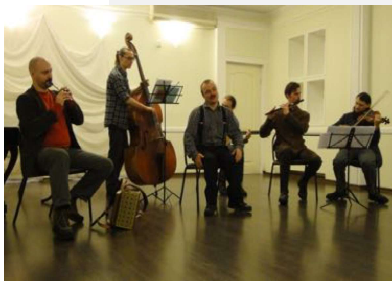
На фото: Волонтеры – музыканты из ансамбля «Воинство Сидов»

Участвуя в культурно-познавательных программах, наши студенты начинают понимать, что послушать хорошую музыку, поговорить на волнующую тебя тему, сходить в театр – это интересные способы проведения досуга.